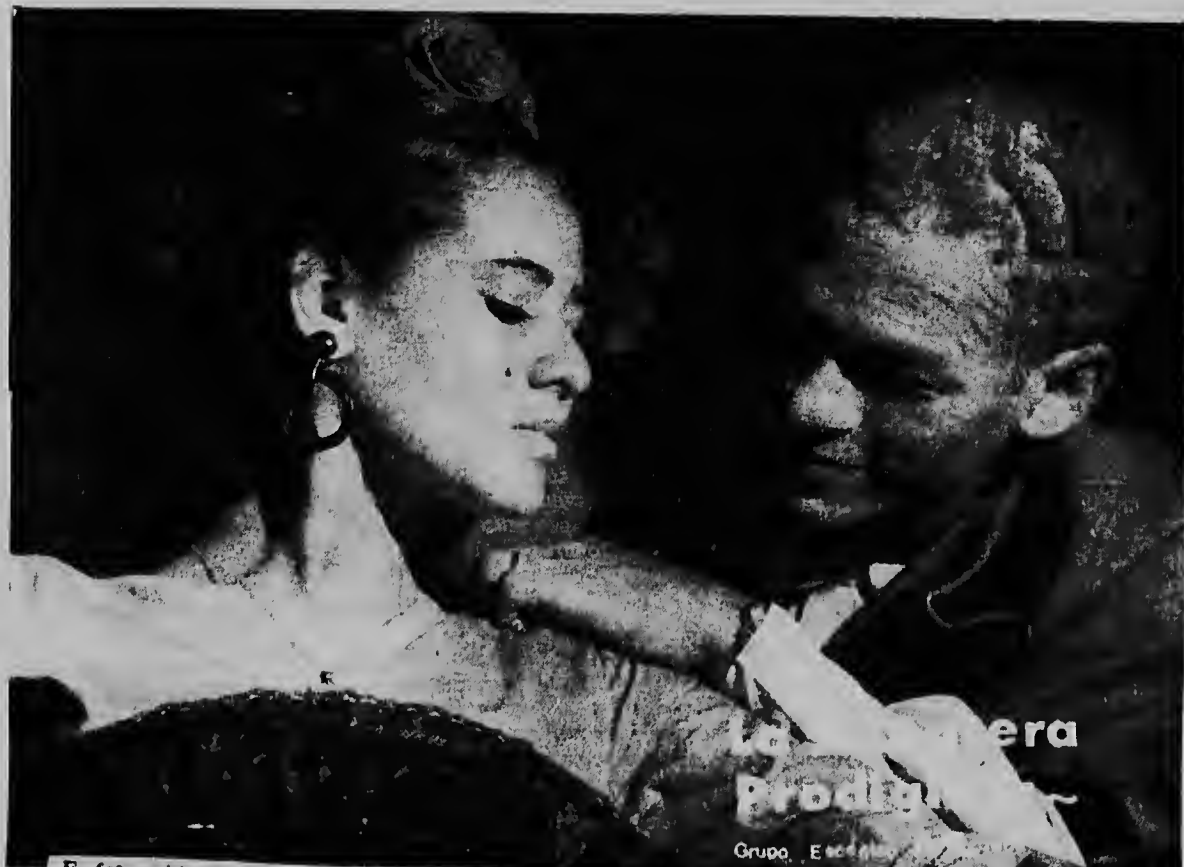
E foto aki ta mustra un escena for di e comedia "LA ZAPATERA PRODIGIOSA," obra maestra di Federico Garcia Lorca, cual lo worde presenta aki na Aruba diasabra awor 15 di juli, den sociedad Bolivariana pa cuarto pa nuebe di anochi. E comedia aki lo worde presenta na Aruba tan solo un biaha. Na Corsow "LA ZAPATERIA PRODIGIOSA" a cosecha masha hopi éxito, y nos lo kier a recomendar nos lectornan altamente pa presencia e comedia aki cual lo worde presenta diasabra awor den Sociedad Bolivariana.